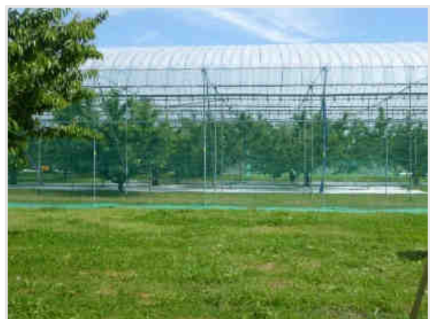
Abb. 4: Überdachte Kirschenanlage – Standard-Anbausystem in der Region Yamagata

Die Bäume, meist auf der Unterlage ‚Colt‘ oder Prunus lannesiana stehend, werden als stark formierte Flachkrone erzogen (open center). Die Pflanzdichte beträgt ca. 200 Bäume/ha. Die Stundenlöhne für die Erntehelfer liegen bei ca. € 9,50/Std, die Pflückleistung beträgt zwischen 12 und 25 kg/Std. Zur Verbesserung der Deckfarbe werden Reflektionsfolien auf den Boden gelegt und ca. 10 Tage von der Ernte Blätter an den Bukett-Trieben entfernt. Das Ziel sind 2 - 3 Früchte mit 2 - 3 Blättern je Bukett-Trieb.