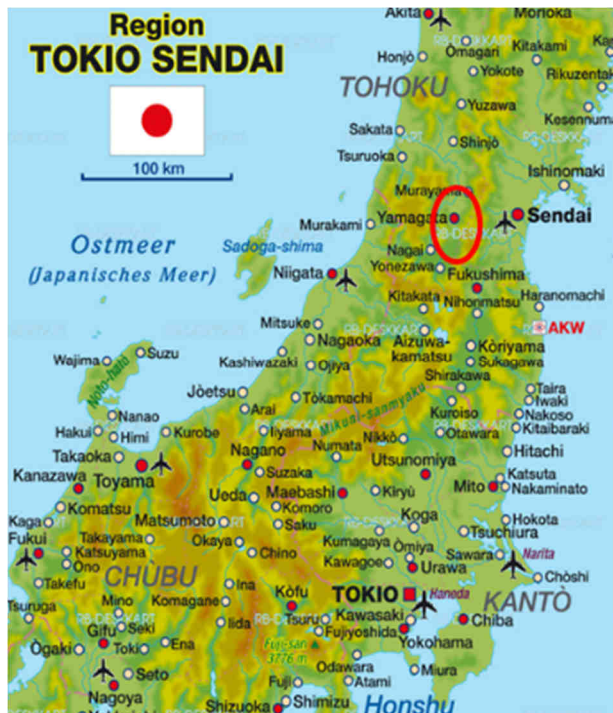
Abb. 1: Yamagata (eingekreist) in der Großregion Tokio-Sendai