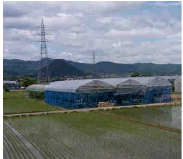
Abb. 2: Kirschenanbau (im Tunnel) neben Reisanbau vor waldreichen Gebirgsketten