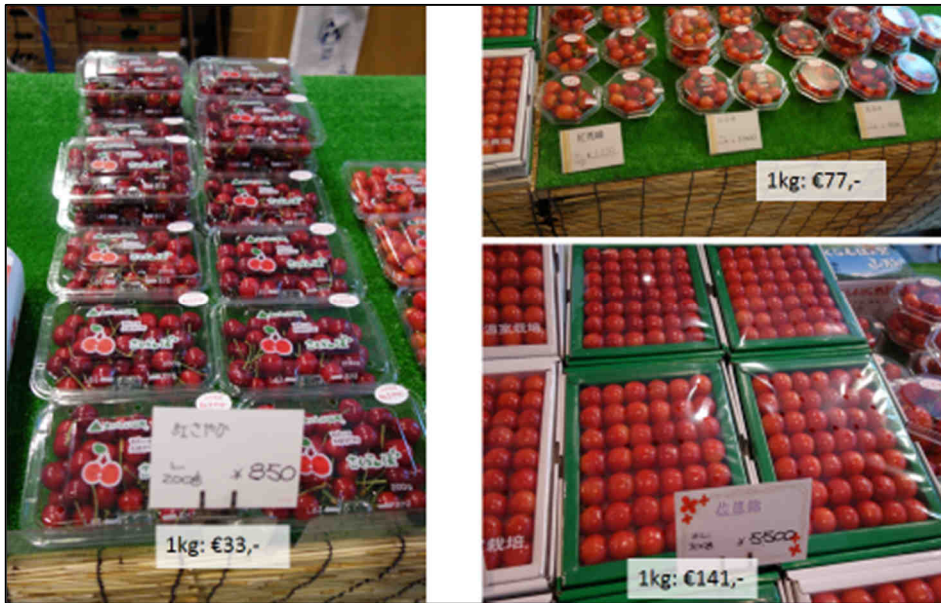
Abb. 3: Verpackungen und Preise von Kirschen, Japan, Juni 2017

Die Anbaufläche für Kirschen ist seit Jahren stabil und liegt knapp über 4000 ha, die Erträge schwanken zwischen 3,7 und 4,6 t/ha (Quelle: FAO-Stat). Einer Eigenproduktion von knapp 20 000 t pro Jahr stehen Importe von rd. 5 000 t gegenüber (World Cherry Review 2017). Importware gilt als schlechter in der Qualität und wird etwas abwertend als „amerikanische Kirschen“ bezeichnet.